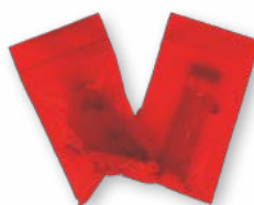
Fixations d'angle, pattes de scellement, visserie (livrées séparément, non montées).