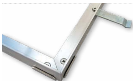
Cadre avec fixation d'angle et patte de scellement (non montées).